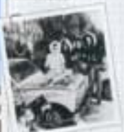
La Renault 5 est un véhicule polyvalent et robuste.