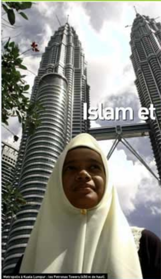
Metropole à Kuala Lumpur : les Petronas Towers (438 m de haut).