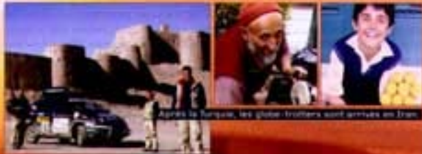
Après la Turquie, les globe-trotters sont arrivés en Iran.

Après avoir traversé d'une traite la Bulgarie, nos trois voyageurs, conquis par la gentillesse des Turcs et la virtuosité des danseuses tourneurs, ont fait une longue halte à Istanbul. Présentation de leur véhicule à la presse locale, visite à l'usine Renault de Bursa, et les voilà de nouveau partis vers l'Est, dans les canyons de la Cappadoce. Direction l'Iran et la chaudière de Bam, la plus grande ville de terre du monde (photo ci-dessous).