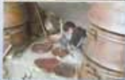
Un moment de la vie quotidienne en Iran. Les habitants de Yazd utilisent l'air humide du désert pour créer un système d'irrigation qui permet de cultiver des légumes et des fruits.

Le tour du monde en Scenic RX4 est une aventure unique. Les trois occupants ont traversé l'Iran du nord au sud, à la recherche de nouvelles expériences et de paysages incroyables.