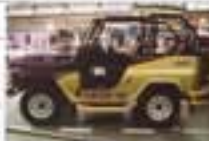
La Lada Niva est un véhicule à quatre roues motrices. Elle est vendue à plus de 100 000 exemplaires par an.